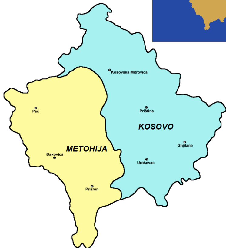
- mapa geografskih regiona Kosova i Metohije -

Kosovo je vnitrozemský stát v centru Balkánského poloostrova. Hlavní město a současně největší město je Priština. Kosovo má rozlohu 10 905 km 2 žije zde asi 1,9 miliónu obyvatel (k roku 2018). Albánci tvoří 88 % obyvatel, Srbové 7 %.