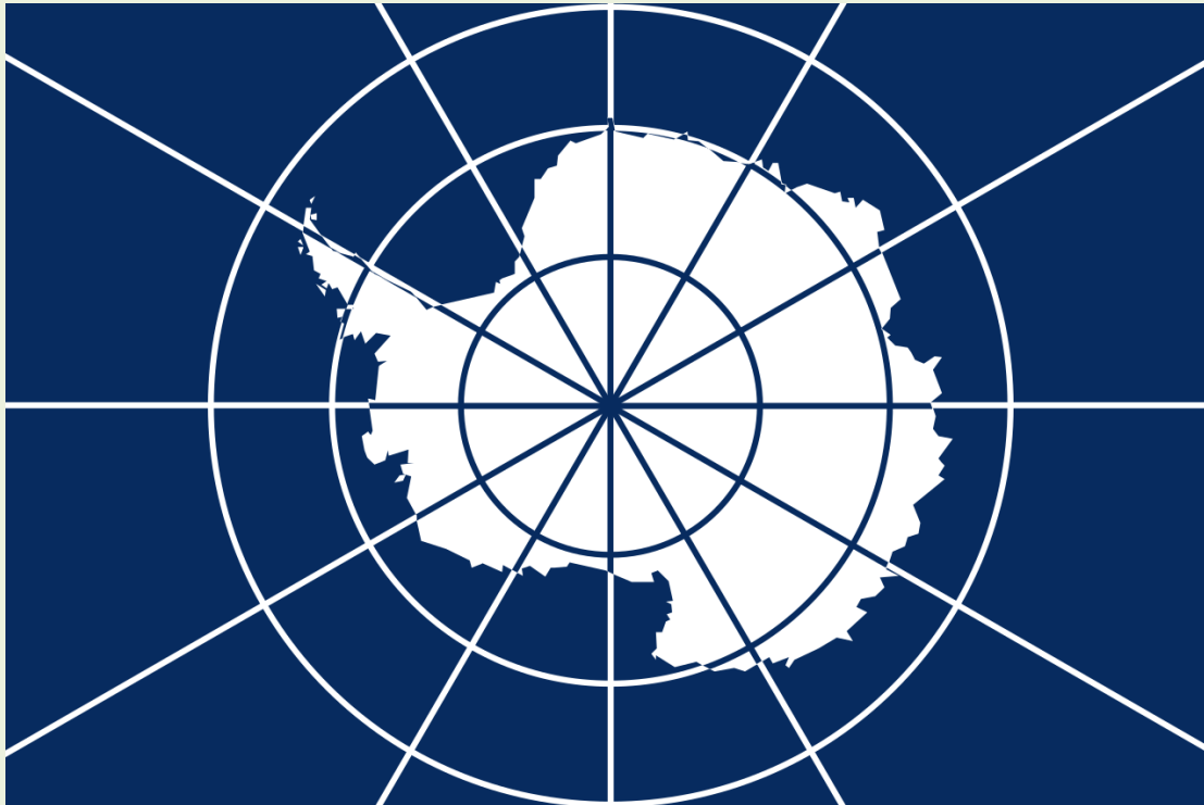
Vlajka Antarktického smluvního systému