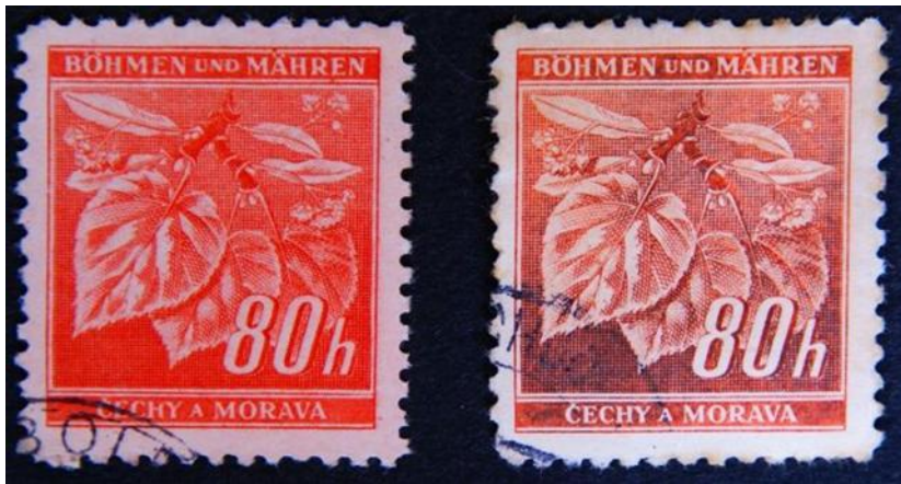
Protektorátní poštovní známky