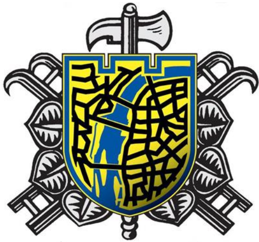
Logo Sboru dobrovolných hasičů Praha 1