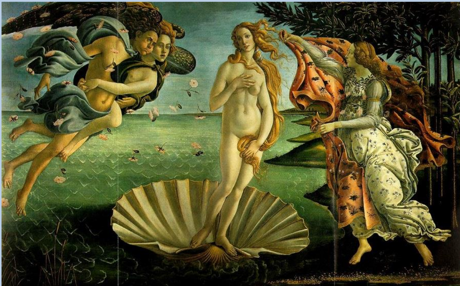
Inspirace řeckou mytologií – obraz Zrození Venuše italského renesančního malíře Sandra Botticelliho (1445-1510).