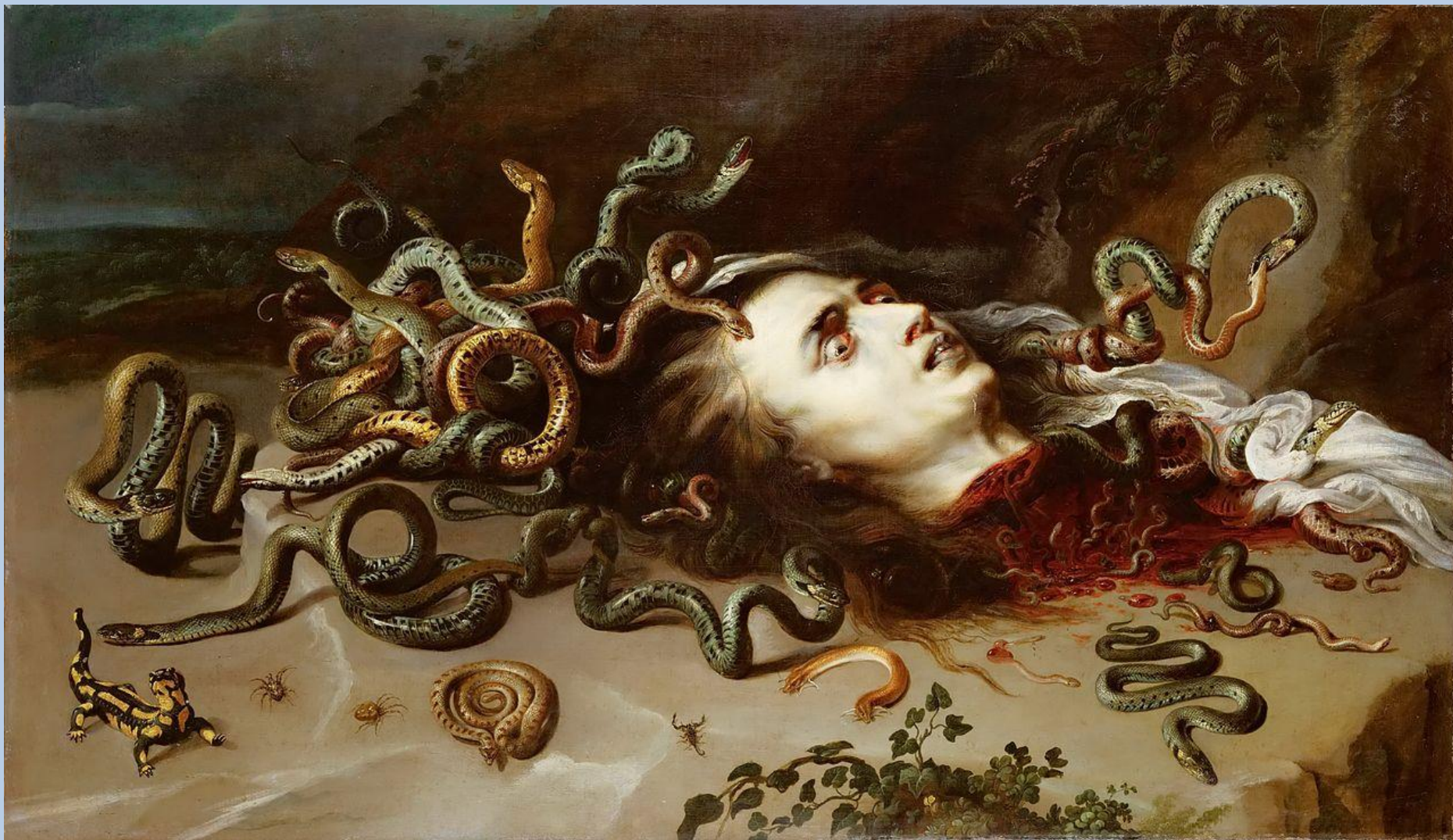
Inspirace řeckou mytologií – hlava Medusy na obraze vlámského malíře Petera Paula Rubense (1577-1640).