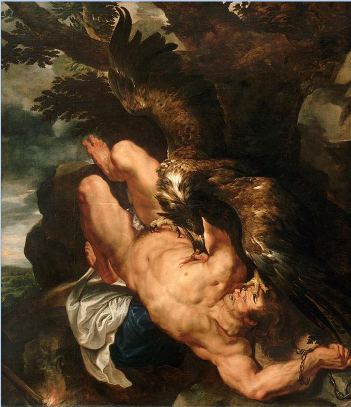
Inspirace řeckou mytologií – obraz Spoutaný Prometheus vlámského malíře Petera Paula Rubense (1577-1640).