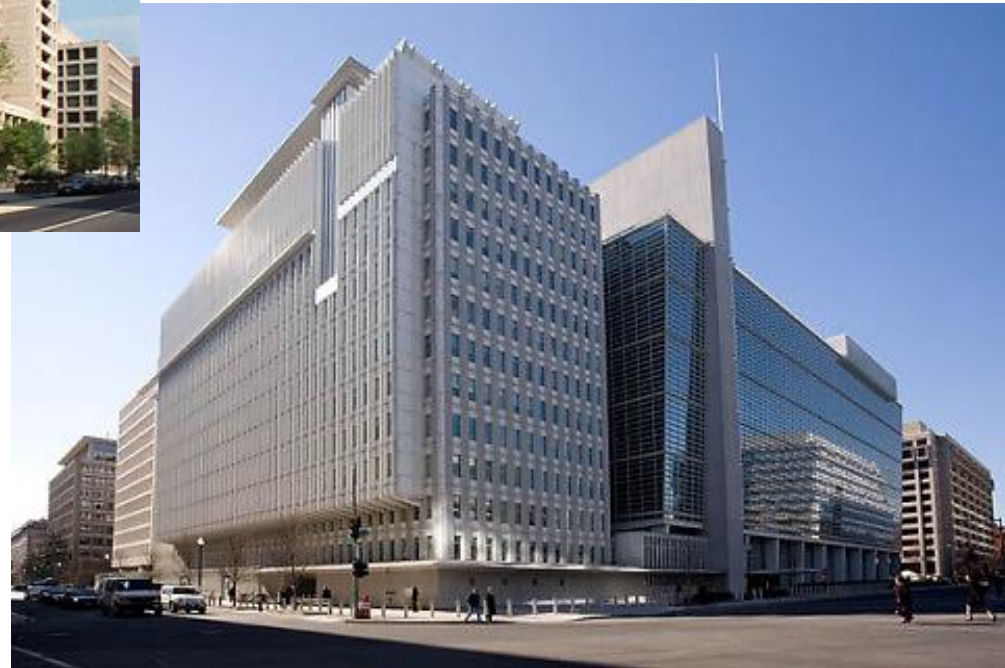
Sídlo SB ve Washingtonu.