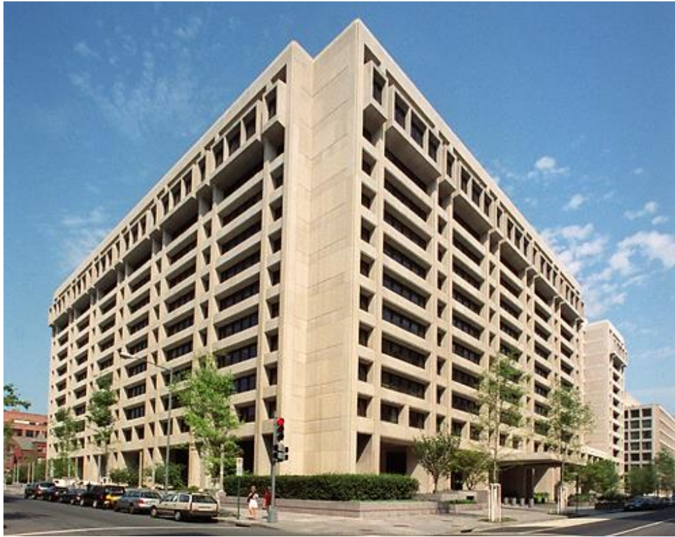
Sídlo MMF ve Washingtonu.