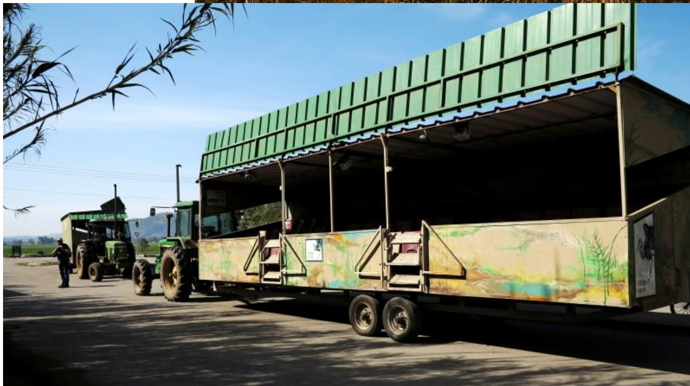
Údolí Chula - Izrael