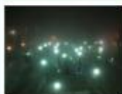
Obrázek ve vysokém rozlišení